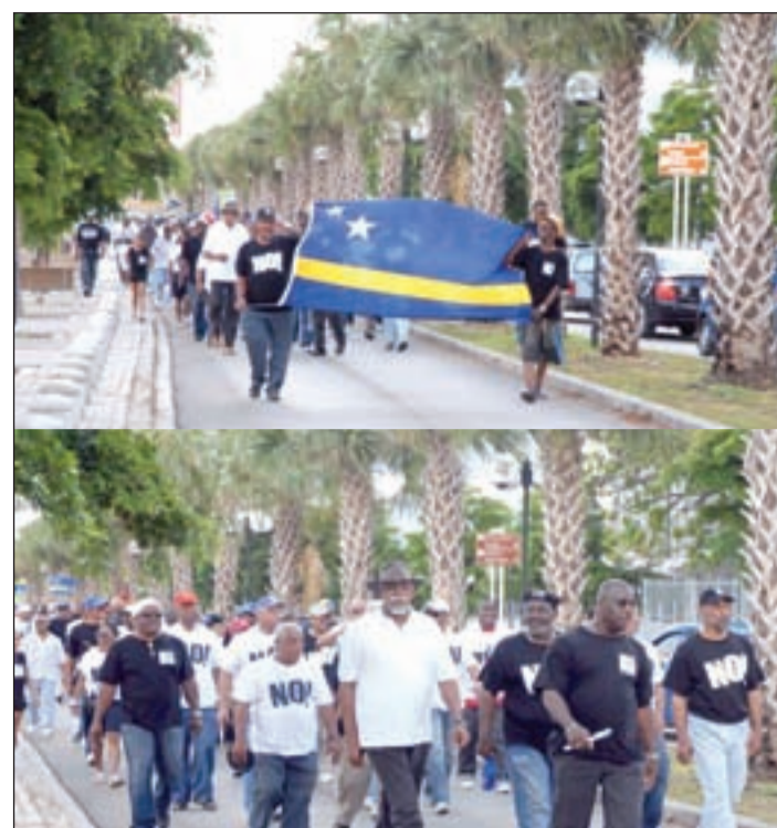
Inicio di e marcha di manifestantenan pa WTC cu lidernan sindical na cabez